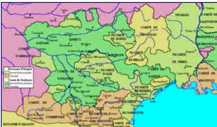
Comtés du Languedoc en 1209, avant le début de la croisade des barons